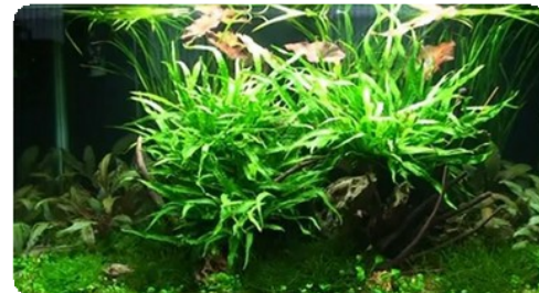
af Oliver Knott

Et dejligt nemt akvarie med kun få krav til vedligeholdelse. De langsomvoksende planter er garanti for lang holdbarhed; når først planterne har fået fat, gror de stille og roligt hvis de får lidt gødning og endnu bedre lidt CO 2 . CO 2 er dog ikke strengt nødvendigt for at få succes med dette layout. Den eneste af planterne som måske kan drille lidt uden CO 2 er Marsilea hirsuta - og den kan man i givet fald så undlade i sit layout.