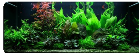
af Dan Crawford

Akvariet der ser flot ud fra starten og er særdeles let at passe. Echinodorus bleheri og Ludwigia vokser hurtigt til og sikrer, ligesom de mange AquaDecor-produkter, at akvariet hurtigt kommer i fin biologisk balance. De mange store blade giver sammen med de store, mørke lavablokke akvariet tyngde, ro og harmoni. Echinodorus quadricostatus kryber frem mellem lavablokkene. Spiky-mos og Cryptocoryner gror frodigt på mindre lavasten og helt små lavasten spredt ud foran fuldender billedet.