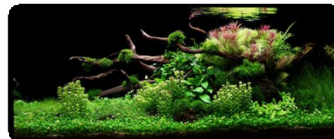
af Adrie Baumann, Ian Holdich

Fra en massiv bakketop af sorte lavasten strækker redwood-grene sig ud over bundlagets mindre lavastykker.