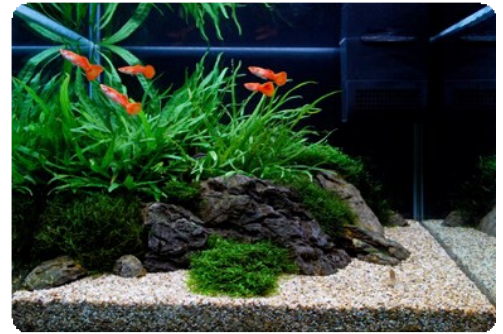
von James Starr-Marshall